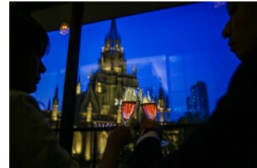
大聖堂ビュー席 イメージ