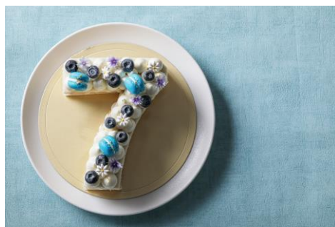
▲ナンバーケーキ 1文字イメージ