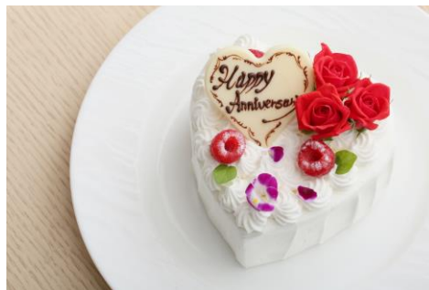
▲ハート型ショートケーキ