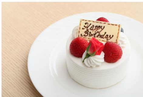
▲ストロベリーショートケーキ