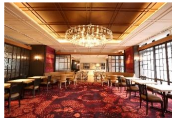
店舗内観 イメージ

※いずれも要予約(ナンバーケーキ：予約の7日前まで／ギミックケーキ：予約の3日前まで／その他：予約の1日前まで)