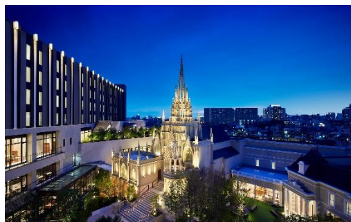
▲ライトアップされたロマンチックな大聖堂