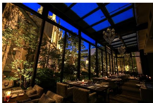
▲フレンチレストラン「グラマシースイート」