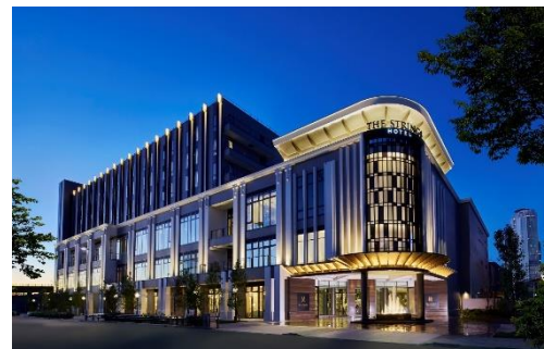
▲ストリングスホテル 名古屋 外観

<ピエール・エルメ(Pierre Hermé)> 21世紀のパティスリー界を先導する第一人者。