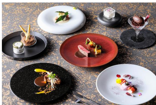
▲フレンチコース料理イメージ