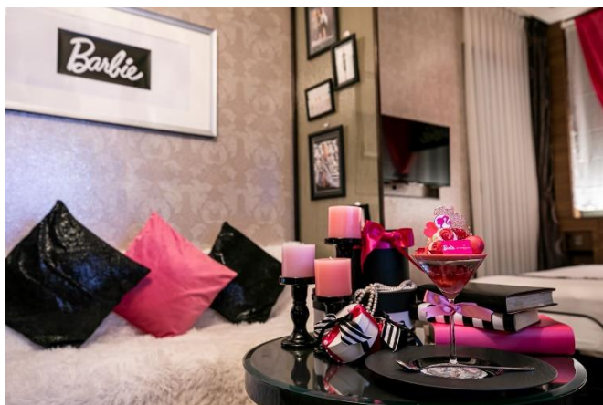
▲宿泊コンセプトルーム