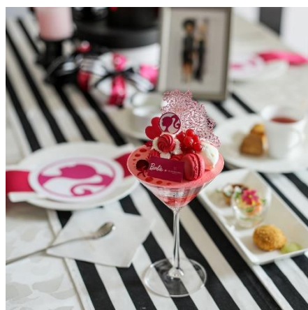
▲日帰りプライベートティールーム

世界で最も人気のあるファッションドール「バービー」とコラボレーションした宿泊ルーム「バービールーム」は、客室に一步踏み入ると“かわいい”がたくさん詰まった“女の子があこがれる”世界が広がります。スイートルームに作られた部屋は、壁や家具、ベッドシートさらにはバスルームまでバービーグッズで埋め尽くされていて、まるで自分がバービードールになったかのような感覚を味わうことができます。また、お好きな時間に「大人のご褒美パフェ」をお部屋でお召し上がりいただける贅沢プラン。「バービールーム」でバービーと一緒にあこがれの一日をお過ごしください。