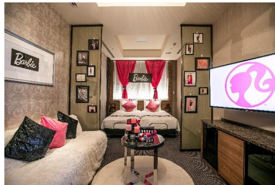
▲宿泊コンセプトルーム

■HP： https://www.strings-hotel.jp/nagoya/recommend/restaurant/10661.html