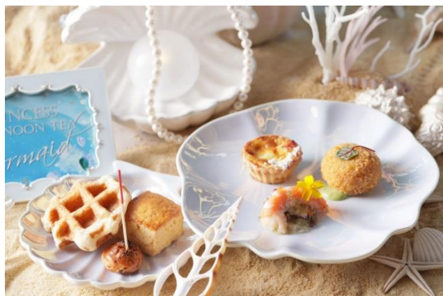
▲スコーン&季節のビューティースープ