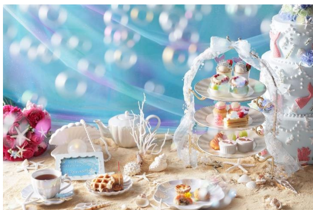
▲プリンセスアフタヌーンティー～マーメイドのパールスイーツ～

・ ドリンク フランスの老舗紅茶ブランド「マリアージュフレール」、挽きたてコーヒーなど、約30種類の中からおかわり自由