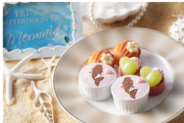
▲スタンド下段スイーツ