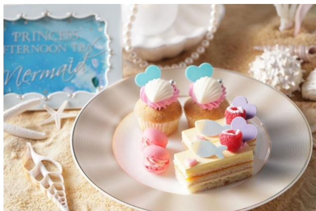
▲スタンド中段スイーツ