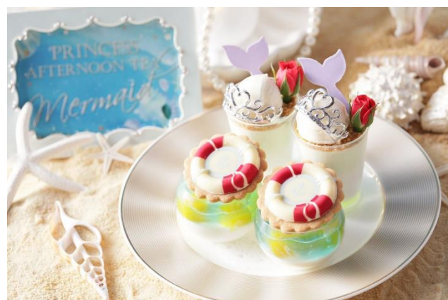
▲スタンド上段スイーツ