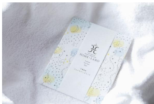
▲姫ラボフェイスパック