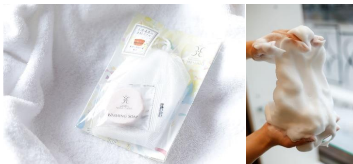
▲姫ラボ石鹸セット 姫ラボの泡はキメ細かくもっちりとした感覚。 美肌の秘訣が詰まっています。