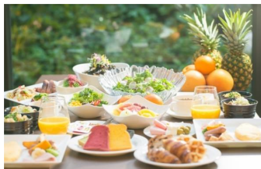
▲ヘルシー・ビューティー・フレッシュをコンセプトとした“シェフズ ライブ キッチン”でのフルブッフスタイル朝食で、身体の中から美しく