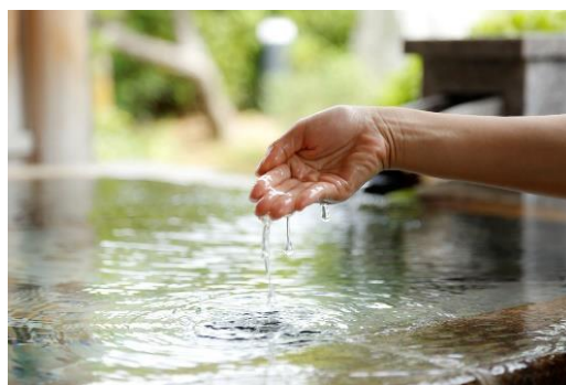
▲日本最古の美肌湯の“玉造温泉”