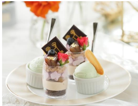
▲カシスマロンのヴェリーヌ/ピスタチオのアイスクリーム(スタンド上段)