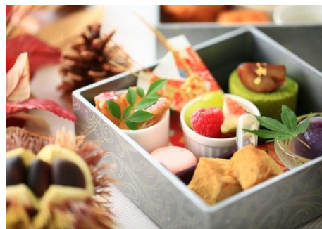
▲紫芋の水饅頭/大学芋/わらびもち/西尾抹茶ロール/水菓子/マカロン(二の重)