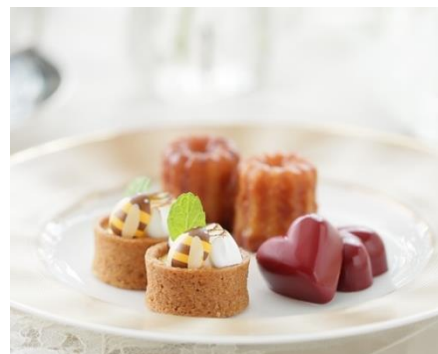
▲カヌレ/ボンボン・ショコラ/季節のタルトレット(スタンド下段)