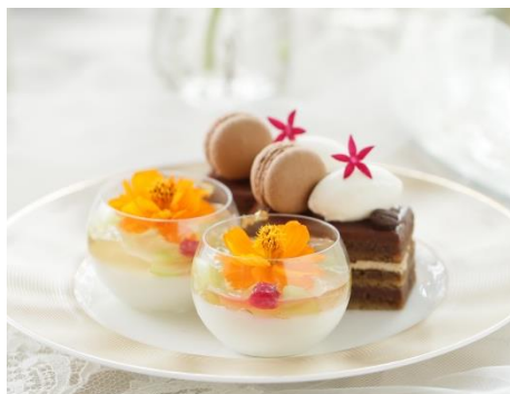
▲ガトーオペラ/ヨーグルトのブランマンジェ エルダーフラワーのジュレ(スタンド中段)