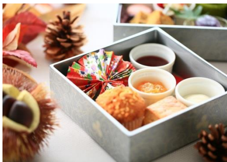
▲栗きんとん/スコーン/キャラメルバナナマフィン(一の重)