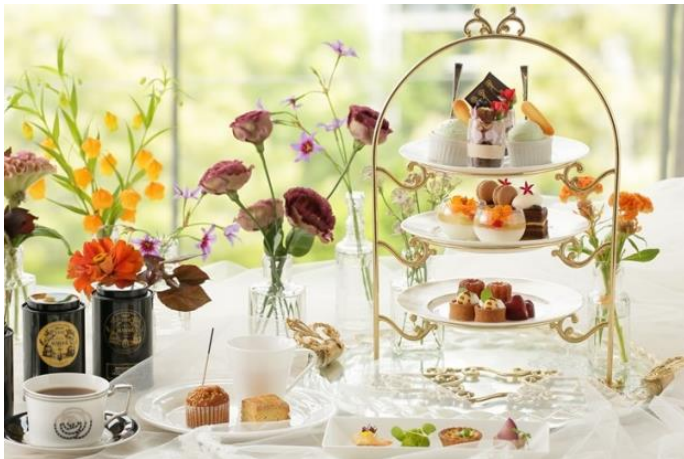
▲スタンドスタイル

“ヘルシー・ビューティー・フレッシュ”をコンセプトに展開するオールデイ・アフタヌーンティーラウンジ&バー「ニューヨーククラウンジ」にて2018年9月1日（土）～11月11日（日）まで秋の味覚を存分に楽しむ2種類の「オータムアフタヌーンティー」を販売いたします。荘厳な大聖堂を臨む光が差し込む大きな窓、シャンデリアが煌く高い天井、ゆったりと寛げるソファ席など優雅なラグジュアリー空間で楽しむ人気のスタンドスタイルと、期間限定でお重スタイルをご用意しております。