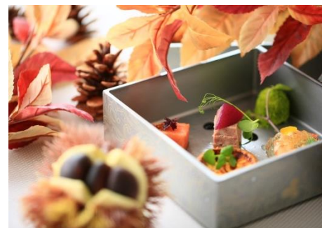
▲シェフ特選本日のセイボリー(三の重)