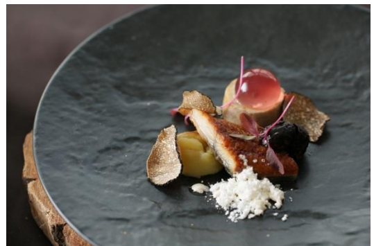
▲フォアグラ、鰻、トリュフのマリアージュが楽しめる前菜