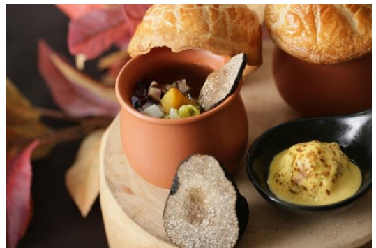
▲黒毛和牛とトリュフを使用したファーストディッシュはパイ包みのスープスタイル