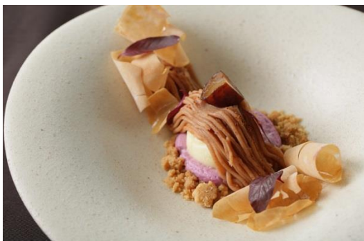
▲トリュフを使用した贅沢なモンブラン