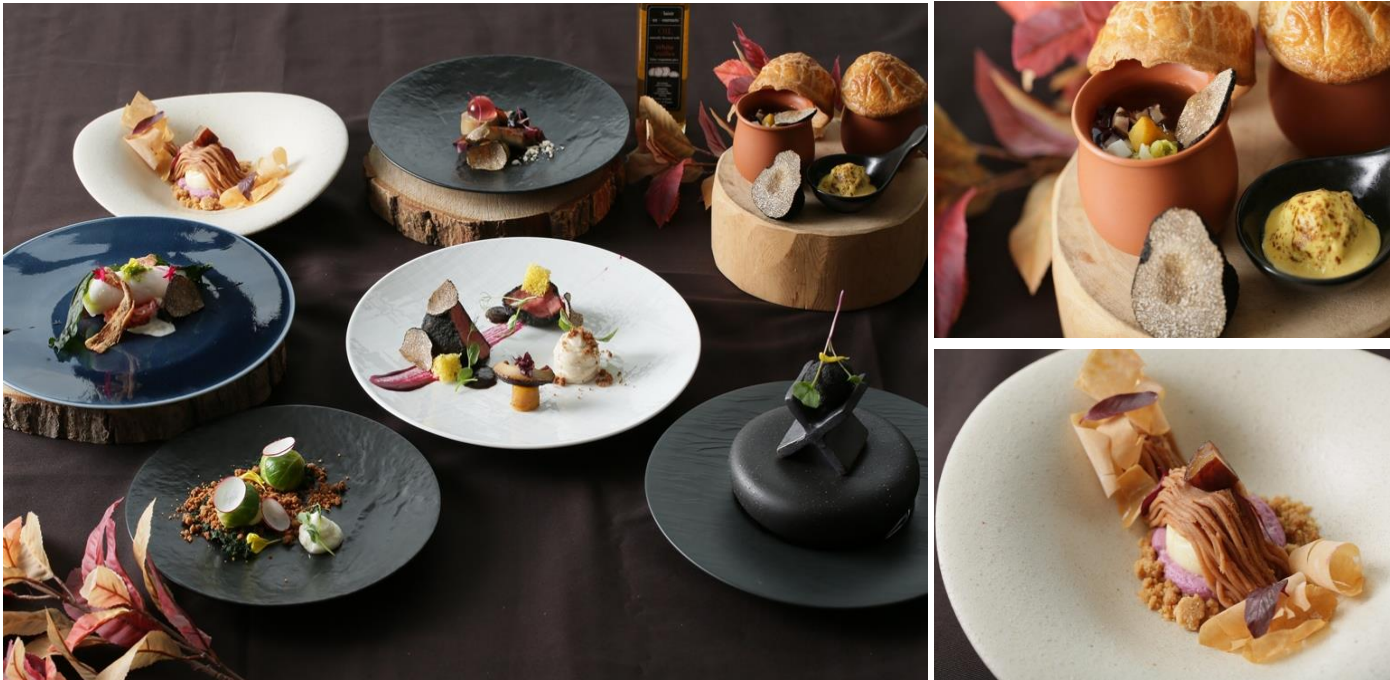
▲“トリュフづくし”コースイメージ

2018年9月1日(土)～11月11日(日)の期間限定で、香り高い“トリュフ”を前菜からデザートまでコース全皿にあしらった「トリュフづくしの贅沢ランチ/ディナー」を販売いたします。