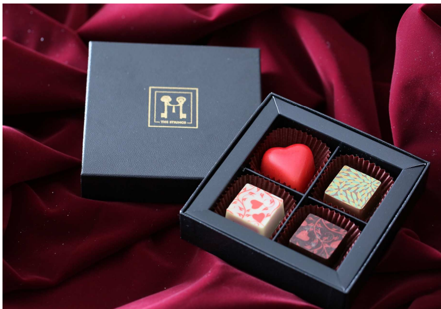
（左上）ハートのフランボワーズ（右上）キャラメル（右下）グリオットチェリー（左下）おちゃらかフレーバー

*「おちゃらか」とは・・・開発者ステファン・ダントンが、日本茶世界への入り口として、果物、花、よもぎや昆布といった日本独特の植物の香りを緑茶やほうじ茶につけたオリジナルフレーバーティーを提供するブランド。「目・鼻・口」で味わう新たなジャンルのオリジナルフレーバーティーは、温かいお茶としてはもちろん、水出し茶として冷たいソフトドリンクとして提供するのにも最適。グラスにそそがれた水出し茶は、透き通るようなゴールドの色合いと、芳しいフレーバー、そして日本茶そのものの深い味わいを「目・鼻・口」でワインのように愉しめる新しいソフトドリンクとして、国内はもとより世界中で人気を博しています。http://www.ocharaka.co.jp/