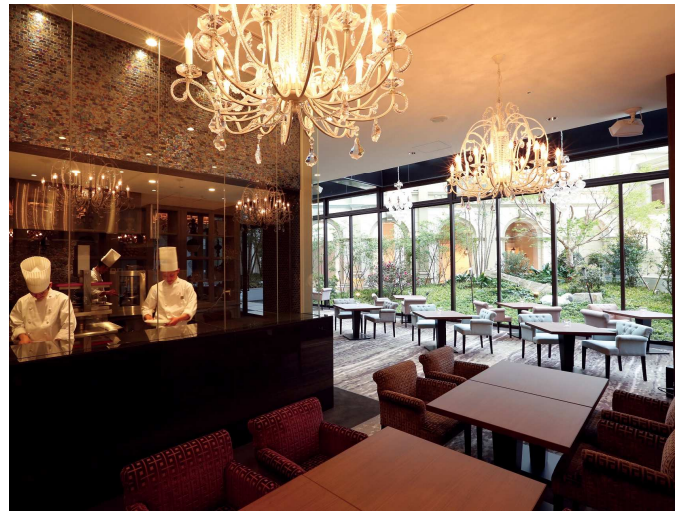
▲グラマシースイート 店内