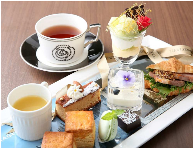
▲グラマシースイート限定「エルミタージュデザートプレート」イメージ

ストリングス ホテル 名古屋(所在地:愛知県名古屋市中村区平池町4-60-7 総支配人:伊藤茂浩)のダイニング & カフェ「グラマシースイート」では、2017年7月1日(土)より愛知県美術館で開催する「大エルミタージュ美術展」を記念し、女帝エカテリーナ2世の“小さなお茶会”をイメージした「エルミタージュデザートプレート」を販売いたします。旬のフルーツのパルフェやフィナンシェ、スコーンやクロワッサンサンドイッチなどを贅沢にワンプレートをご用意。エルミタージュ美術館の礎を築き、サンクトペテルブルグを芸術と文化の都へ導いたとされる女帝エカテリーナ2世。贅の限りを尽くした宮殿で少人数の親しい友人との集まりを“小エルミタージュ”と呼んだ逸話も。そんな逸話にインスパイアされた優雅なお茶会を美しいデザートとともに楽しみいただけます。